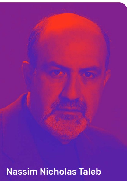
Nassim Nicholas Taleb

Konverentsi kõige tuntum esineja on Nassim Nicholas Taleb . Ta on vastuoluline majandusmõtteleja, kes ennustas õigesti ette 2008. aasta finantskriisi ja on kirjutanud 6 bestsellerit, mis on müünud üle viie miljoni eksemplari.